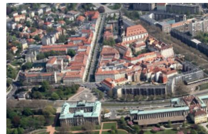
Palaisplatz als Eingang zum Barockviertel